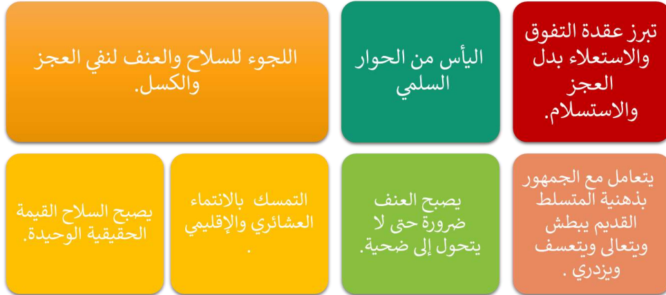
الشكل 4: المظاهر النفسية للإنسان المقهور في مرحلة التمرد والمجابهة