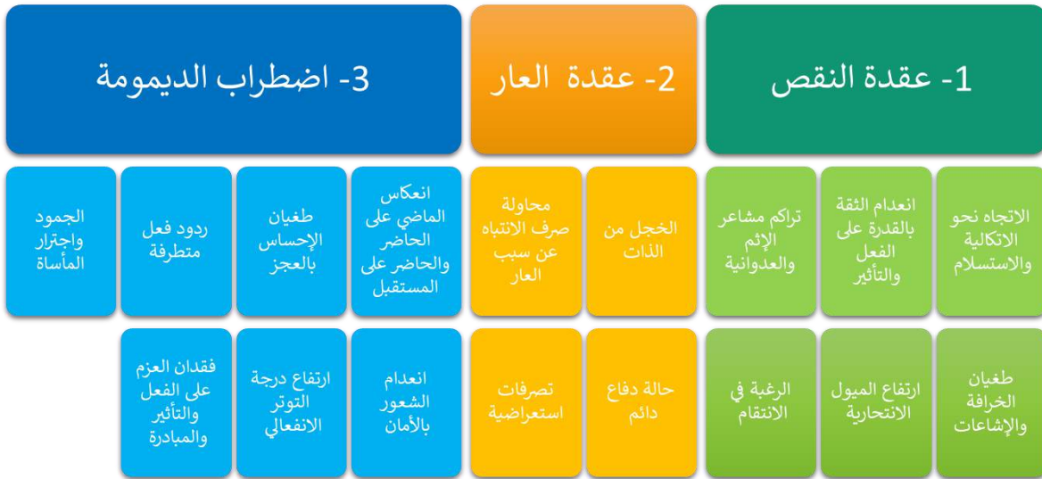
الشكل 2: المظاهر النفسية للإنسان المقهور في مرحلة التسلط والرضوخ

تنشط فيها الأحكام التبخيسية التي تعتبر الجماهير غير قادرة على أن تحكم نفسها، ويصبح الكذب جزء من العلاقات والصدقة مع ادعاء القيم السامية والرجولة، تبرز بين الجموع مجموعة من العقد: