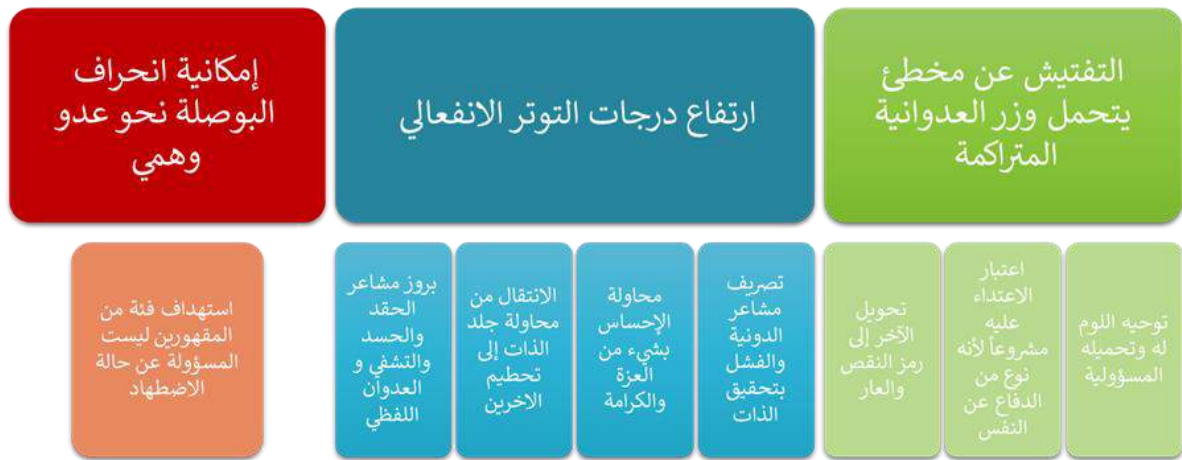
الشكل 3: المظاهر النفسية للإنسان المقهور في مرحلة الاضطهاد

تفسر الفقرات السابقة ردود الفعل السلبية على الحملة المدروسة، حيث إنها لم تكن موجهة للعاملين في المجال الإنساني بحد ذاتهم، بقدر ما كانت محاولة لتفريغ المشاعر العدوانية المتراكمة والبحث عن مخطئ يتم تحميله المسؤولية، ويصبح رمزاً للسوء والعار، حيث إن هذه الخطوة من تشعر المقهورين بشيء من العزة والكرامة وتخفف عنهم مشاعر الذنب ولوم الذات، من خلال تصريفها بالمواجهة غير المباشرة والتعليقات الاتهامية.